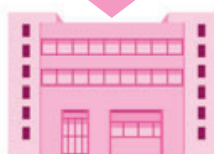
新潟県共同募金会