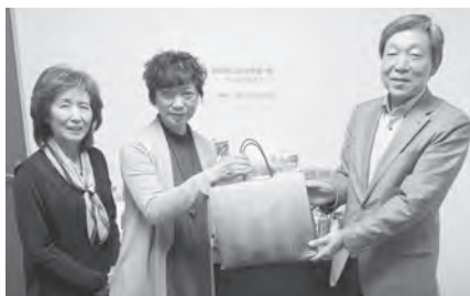
左から渡邊女性部副部長、坂井女性部長、社協会長

安田商工会女性部は、部内でフードドライブ(期間：11月1日～30日)を実施。12月10日(金)にお届けいただいた食料品等は年末に暮らしサポートセンターあがのへの相談者はじめ、市内の必要とする方々にお渡しすることができました。