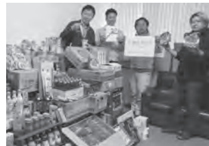
京ヶ瀬商工会青年部員の皆さん

京ヶ瀬商工会青年部は、全京ヶ瀬商工会員に呼びかけフードドライブ(期間：12月1日～17日)を実施。12月22日(水)にお届けいただきました。こちらは新年になり、暮らしサポートセンターあがのを通じて提供しています。