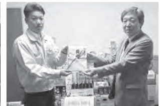
左から小林青年部長、社協会長