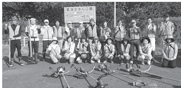
作業開始前に笑顔の一枚