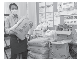
フードドライブは、各郵便局の営業時間内に受け付けています。(写真は京ヶ瀬郵便局)