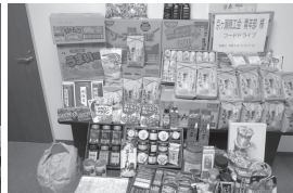
京ヶ瀬商会青年部 様