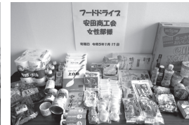
安田商会女性部 様