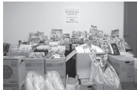
ロム・アンド・ハウス電子材料株式会社 笹神工場 様