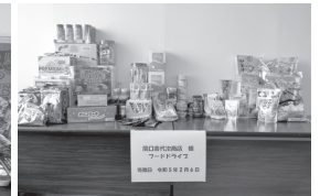
関口喜代次商店 様