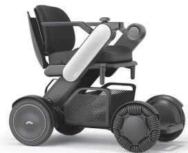
電動車イスWHILL (ウィル) の体験も予定しています。